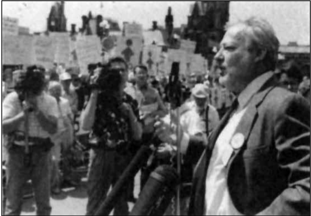
Manifestation sur les conditions des retraitées canadiennes devant le parlement d'Ottawa le 14 mai 1986.