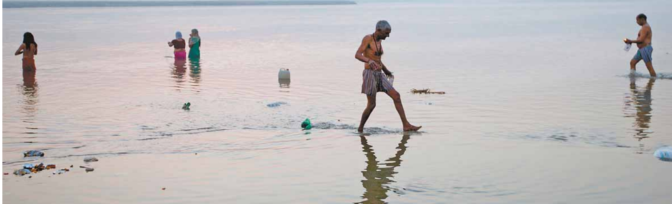
La montée de l'écologisme a entraîné une mutation du regard porté sur les espèces vivantes et les écosystèmes. En Inde, le Gange, fleuve sacré, est depuis 2017 reconnu par la loi comme une entité vivante ayant le même statut qu'une personne morale.

Les intellectuels tentent encore et toujours de comprendre et d'expliquer les grands changements sociaux. D'où viennent les théories dominantes? Quelles sont-elles? Quels «ismes» gouvernent les courants de pensée actuels? Voici un petit panorama des grandes idées qui agitent aujourd'hui les sciences sociales devenues des cultural studies .