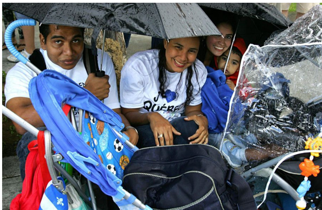
Le Québec se distingue du reste du Canada par la présence d'une culture majoritaire en interaction avec les nombreuses minorités ethniques.

versité y a été traditionnellement structurée [...] par le paradigme de la dualité, plaçant au premier rang l'articulation majorité-minorités ». Est-ce à dire que l'État devrait accorder plus de légitimité à des échanges entre membres de la majorité culturelle et personnes issues de minorités ? La réponse de Bouchard demeure ambiguë.