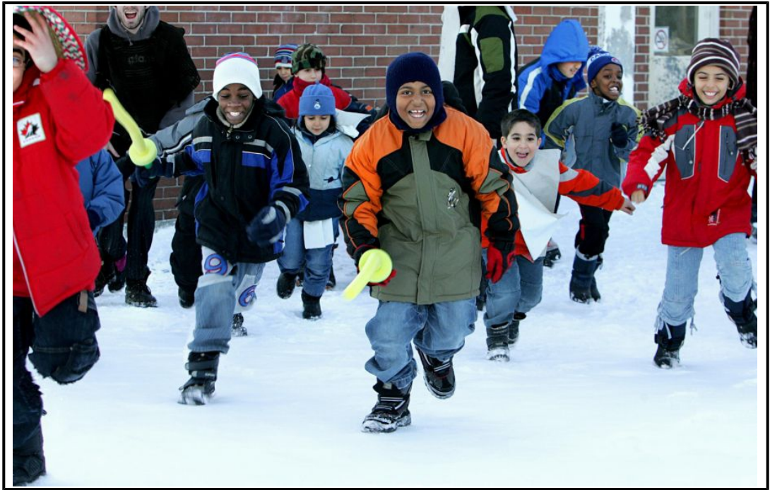
Les sondages sur les accommodements raisonnables menés depuis 2006 démontrent de nettes convergences entre Québécois de toutes origines.

Pour prouver que l’interculturalisme québécois fonctionne moins bien que le multiculturalisme canadien, il faudrait à tout le moins utiliser des indicateurs similaires, ce qui est impossible compte tenu du statut politique du Québec. Pourtant, pour des raisons plus politiques qu’intellectuelles, M. Jedwab répète sur toutes les tribunes qu’il n’y a pas de différences entre ces deux politiques. Je ne suis pas la seule à soutenir le contraire. Rappelons qu’en 1971, le gouvernement fédéral de Pierre Elliott Trudeau a fait adopter la politique du multiculturalisme, à laquelle tous les gouvernements du Québec se sont opposés au nom de la protection du français, langue officielle du Québec, ainsi que des caractéristiques politiques et culturelles de la nation québécoise. Les peuples autochtones ont fait de même pour ne pas être classés comme grands « groupes ethniques ».