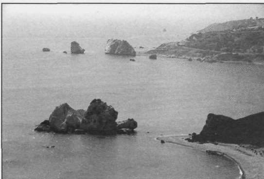
Slika 5: Zaliv Petra Tou Romiou v bližini Paphosa, kjer se je po grški mitologiji rodila boginja lepote Afrodit, simbol otoka.

Popolnoma na novo je bilo zgrajeno prometno omrežje, letališče v Larnaci in Paphosu, pristanišče v Limassolu ter omrežje za vodno oskrbo in namskalni sistemi. Med gospodarskimi panogami najbolj izstopa kmetijstvo, ki zaposluje 14 % aktivnega prebivalstva in prispeva četrtno dohodka od izvoza. Ciper je največji izvoznik sadja in zelenjave na tržišču Arabskega polotoka. V arabskem svetu so zelo iskana tudi ciprska gradbena podjetja. Republika Ciper je uspešna tudi na področju pomorskega prometa, turizma, trgovine in bančništva. V teh dejavnostih je zaposlenega 57 % aktivnega prebivalstva, ki ustvari 60 % domačega proizvoda. Ciprsko ladjeve premore več kot 2000 ladij z 22 milijoni brutoregistrskih ton, kar ga uvršča na 5. mesto na svetu. Z us-