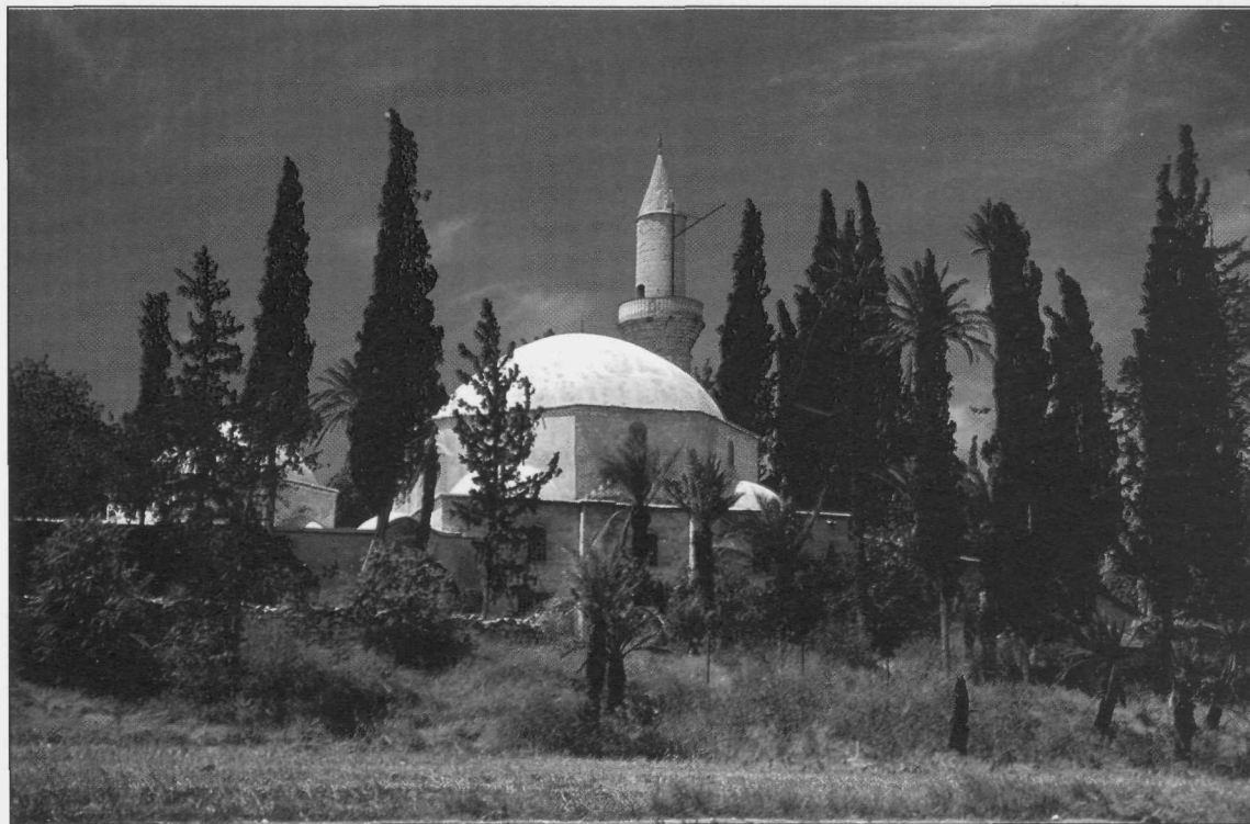
Slika 4: Mošeja Hala Tekke Sultan v bližini Larnace, do leta 1974 največje zbirališče muslimanskih romarjev na otoku.

Kljub sorazmernemu miru taka ozemeljska ureditev ni mogla dolgo trajati. Na pogajanjih je vsaka stran vztrajno zagovarjala svoje stališče glede ureditve države, Grki unitaristično, Turki federalistično.