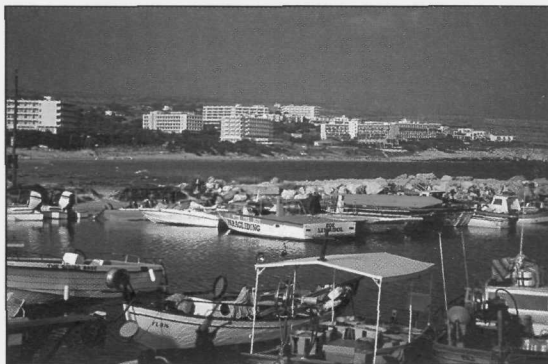
Slika 3: Novo obmorsko letovišče Ayia Napa ob jugovzhodni obali Cipra.