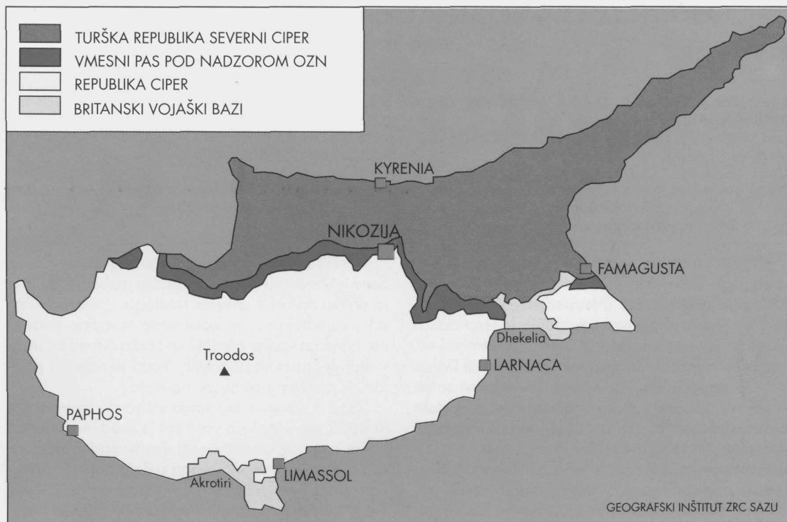
Slika 7: Ozemeljska razdelitev Cibra po letu 1974 (4).

razvito Republiko Ciper. Ciprski Turki predlagajo popolno federalizacijo otoka, kjer bi obe narodni skupnosti ostali razmejeni in imeli vsaka svojo vlado z maksimalno avtonomijo ter skupno zunanjo, obrambno in monetarno politiko. Po četrtem predlogu naj bi ostalo stanje tako kot je, odprli pa bi nekaj mejnih prehodov v današnji razmejivni coni.