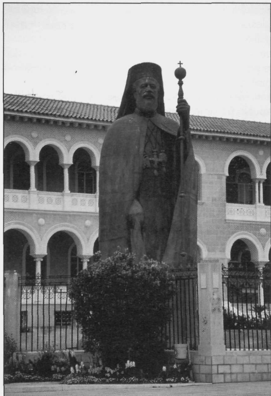
Slika 2: Spomenik nadškofu Makariosu (1913–1977), očetu neodvisnega Cipra in predsedniku države med letoma 1960 in 1974.

Zaradi lege na stičišču različnih kultur ter naravnih bogastev (rudniki bakra so dali otoku tudi ime), je bil Ciper v zgodovini plen velikih političnih sil, ki so na njem zapustile sledi v obliki bogate kulturne dediščine. Do leta 58 n. št. je bil Ciper del antične Grčije. Po priključitvi k rimskemu imperiju je bil podvržen pokristjanjevanju. Sledilo je obdobje Bizantinskega cesarstva v letih od 395 do 1191, ko je grško prebivalstvo sprejelo pravoslavno vero. V naslednjih tristo letih je bil Ciper svobodno katoliško kraljestvo pod vladavino francoskih križarjev. Iz tega obdobja so ohranjeni številni spomeniki gotske arhitekture. Nato je otok prešel pod upravo Beneške republike. Kot zadnja trdnjava krščanstva v Sredozemlju se je dolgo upiral otomanskemu ekspanzionizmu. Turki so se ga končno polastili leta 1571 in ostali na njem do leta 1878. To je bilo obdobje stagnacije, ko se je na otok priselilo 20.000 turških vojakov, njihovi potomci pa predstavljajo danes turško manjši-