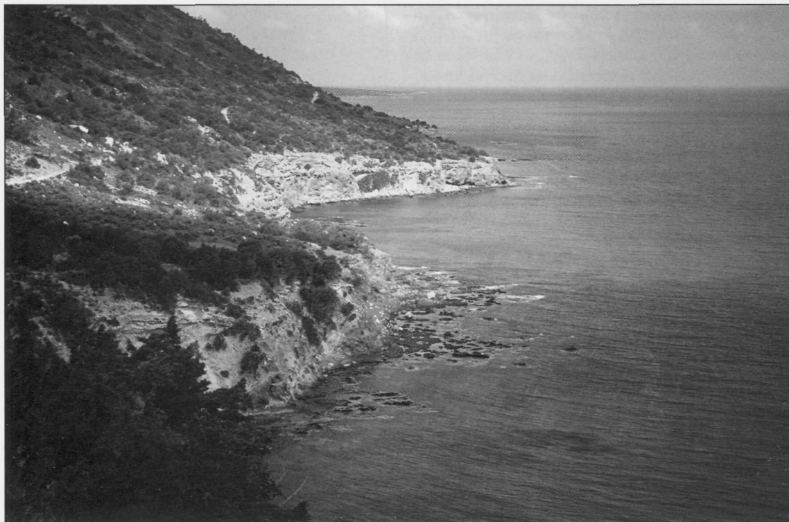
Slika 6: Skrajni zahodni rt otoka Cap Arnavutis še ni podlegel masovnemu turizmu.

vedno prisotnih 30.000 vojakov turške vojske. Poleg tega so se v izpraznjene grške vasi sistematično naseljevali priseljenci iz Anatolije, s čimer se ni spremenila le narodna sestava otoka, pač pa tudi identiteta oziroma mentaliteta ciprskih Turkov. O številu ni točnih podatkov, ocene se gibljejo med 60.000 in 80.000 (1). Tudi denarno je država odvisna od Turčije, saj je turška lira edina legalna valuta. Največji problem je gospodarska nerazvitost, čeprav je ob zasedbi ostala v turških rokah polovica gospodarskih potencialov otoka. Država sicer prejema pomoč Ankare v višini 80 milijonov USD na leto, kar omogoča vzdrževanje življenjske ravni le na stopnji Turčije. Letna inflacija je tudi do 60%. Gospodarstvo skoraj v celoti temelji na kmetijstvu, ves uvoz in izvoz pa potekata prek Turčije. Ker država ni mednarodno priznana, je pod gospodarskim embargom, ki ga uravnava južna sosedja. Letališča so zaprta za mednarodni promet. Hotelski kompleksi v okolici Kyrenie in Famaguste so od leta 1974 zapuščeni. V vseh pogledih je Turška republika Severni Ciper neke vrste čezmorska provinca Turčije z dvajsetlet-