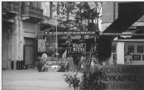
Slika 1: Ulica v središču Nikozije (grško Levkosia, turško Lefkosia) z demarkacijsko črto pod nadzorom modrih čelad OZN, ki deli ciprsko glavno mesto na grški in turški del. T. i. »zeleni črta« je prehodna le za diplomate in pripadnike OZN.

Otok Ciper leži na skrajnem vzhodu Sredozemlja, 97 km od sirske obale, in pomeni zadnje evrop-